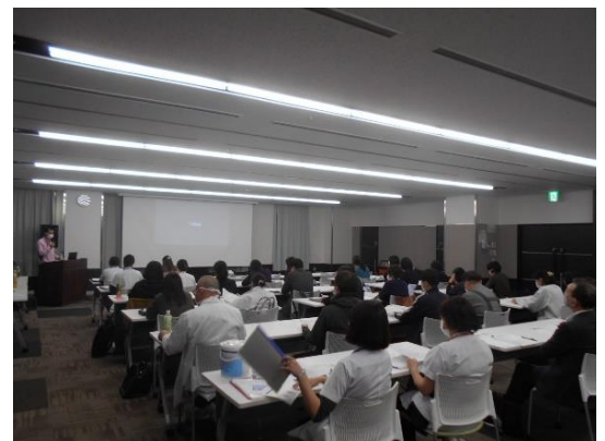
たくさんの医療・介護関係者に御参加いただきましたが、ハンドブックの周知がまだまだ不足していると感じました

5年ぶりに改訂・発行した‘2023年度版北上市入退院ハンドブック’を活用した研修会を開催しました。県立中部病院等入院床のある医療関係者と、高齢者の在宅療養や施設入所でのケアに関わるケアマネジャー等介護関係者が一堂に会し、入退院時におけるそれぞれの役割と連携手法について、ハンドブックを活用しながら確認しました。講義の後にはグループワークを行い、「ハンドブックの使い勝手」について意見交換を行い、入退院時における医療と介護の必要な連携についての課題などを出していただきました。