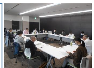
入退院支援ハンドブックの改訂にあたり、「北上市入退院支援作業部会」で何度も議論して改訂作業を行いました。