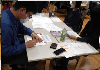
多職種が集まり、熱心にグループトークをして、発表していただきました。